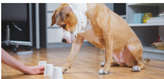
Brincadeiras diversas com pessoas